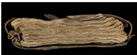
Abb. 1: Der Einband von Sarnen, Cod. chart. 208, Benediktinerkollegium Sarnen.

Gebetbücher aus dem Mittelalter – der Fokus liegt vor allem auf dem Spätmittelalter – sind einerseits Sammlungen verschiedener Gebete für die liturgische und die private Andacht. Das Buch beinhaltet aber auch Texte, die auf verschiedene andere Alltagspraxen hindeuten. Hier will ich mit Ihnen kurz die vierte Lage betrachten. Eine Lage, die vermutlich später auf die darauffolgende aufgenäht wurde.